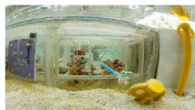
Corals or other experimental organisms kept on racks in experimental chambers